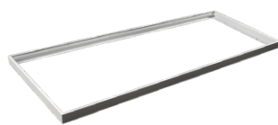
Rama do montażu natynkowego 595x 1195 mm